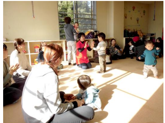
▲お母さんやスタッフと手遊び

まずは、自分達が笑顔で接することです。 笑顔の人は、もっと“えがお”に。笑顔でなかつた人も帰る時には、きっと“えがお”に。