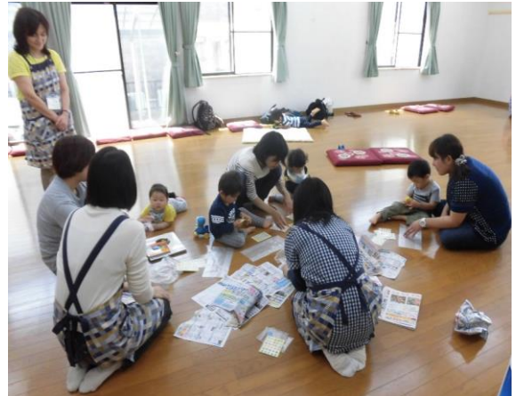
▲シールをペタペタ貼って遊びました

子ども達と遊びながら、親同士のコミュニケーションを深め、子育ての悩みの聞き手となり、子育ての各種情報提供をしています。