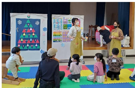
▲英語を使った遊びにワクワク！

英語を遊びながら触れ合えるサロンです。 はじめて英語に触れるお子さまや英語の苦手なママ でもどなたでも参加できるよう心掛けています。