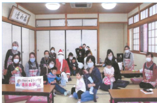
▲クリスマス会の集合写真です

誰でも気軽に参加でき、親子が楽しめる地域のたまり場、子ども同士の遊び場、子育ての悩みや育児ストレスを解消する場となるよう心がけています。