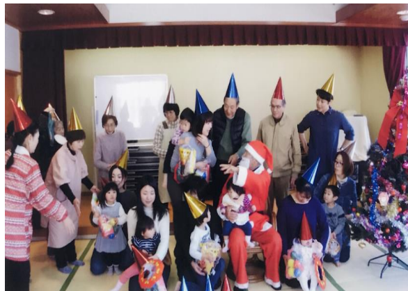
▲クリスマス会にサンタさんが登場！

みなさんの子育てを応援しています。 みんなで待ってるよ～！当日飛び込みOKです。