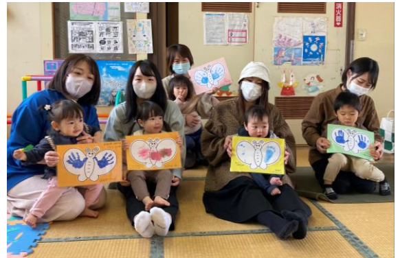
▲小さな子どもも安心して遊んでいます

活動場所が元保育所で、幼児室や広いホール、 畳の図書室や遊具などがあり、のびのびゆったり と遊べます。また夏には水遊びもします。