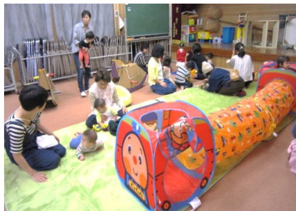
▲手作りの遊具もあります

参加者を地域限定にせず、いつでも受け入れています。各月、出前保育を受けていて、みんなで楽しい歌や親子ふれあい遊びを行っています。参加費無料で、おやつもあります。