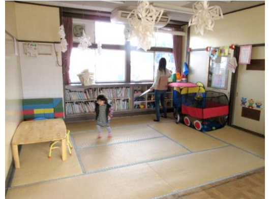
▲ひたちなか子どもふれあい館は 自由にみんなで遊べます

子育て支援を目的に地元の自治会や子ども会、高齢者クラブや民生委員の他、多くのボランティアの方達で運営しています。