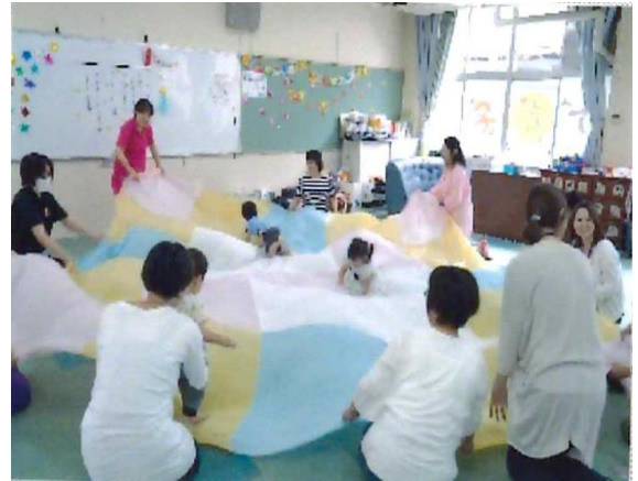
▲みんなで一緒に楽しんでいます