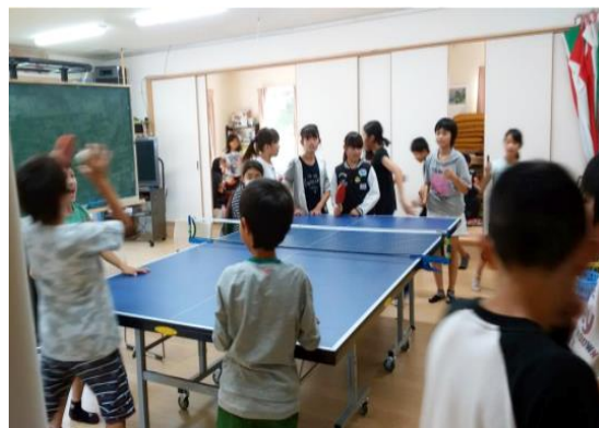
▲長松子ども館はいつも賑やか！

広い長堀公園内にある長松自治会倶楽部を利用し、自治会として子育て支援を行っています。子ども達の友達との遊び場提供、不定期で講習会なども開催しています。