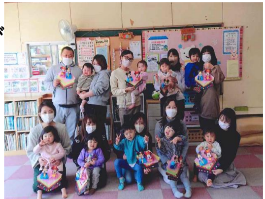
▲みんなでおひなさまを作りました