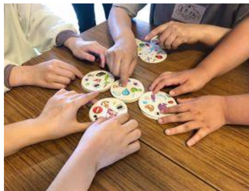
▲みんなで楽しく遊べます！