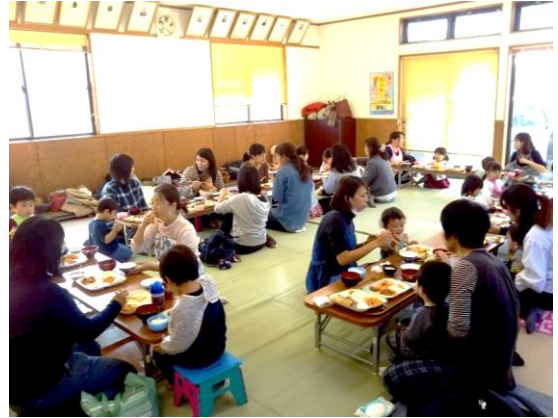
▲みんなと一緒に昼食を食べます