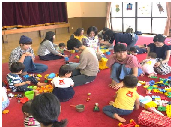
▲たくさんのおもちゃで遊びました