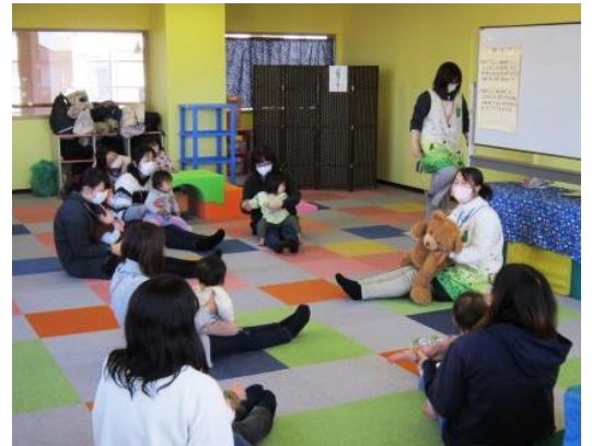
▲おもちゃの時間以外も内容盛りだくさん！

予約不要・参加費なし。誰でも気軽に入って下さい。子供たちを自由に遊ばせながら周りの人と交流し、お友だち作りしましょう。