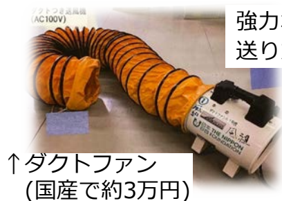
強力な風を送りたい時は...