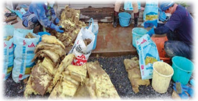
浸水したグラスウール