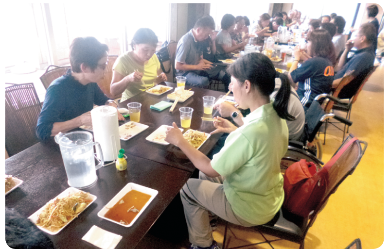
みんなで楽しくいただきました

参加者からは「また来年も参加したい」との声があり、楽しい時間を過ごすことができたようです。