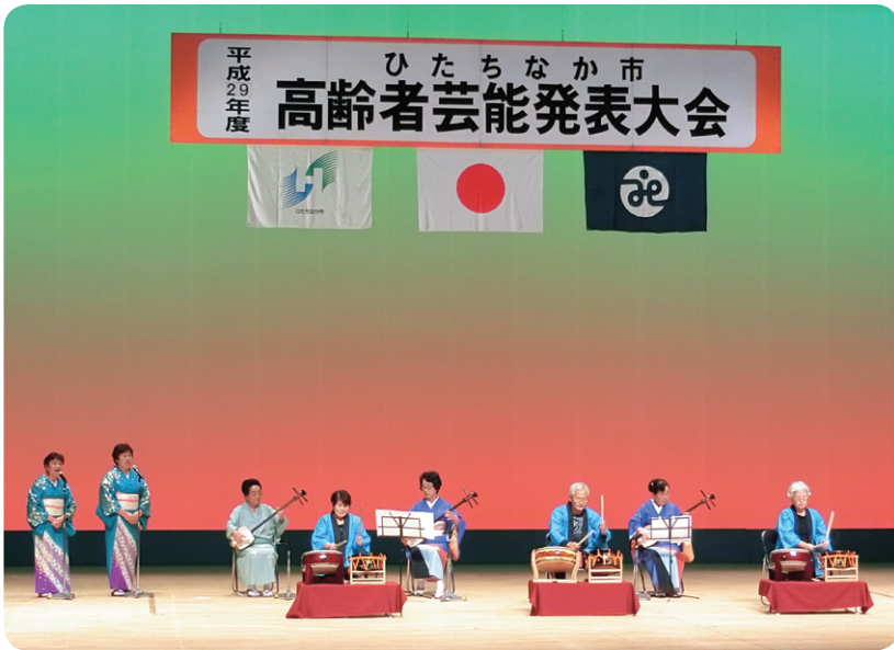
今年はどのような演目になるか楽しみです (写真は昨年の様子)