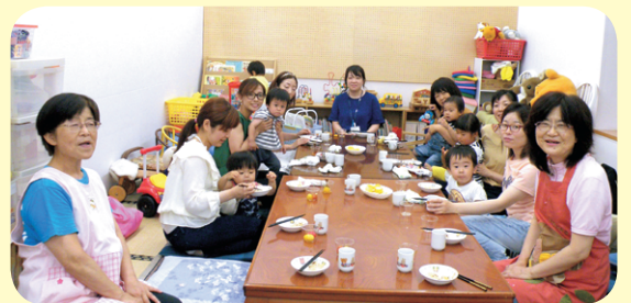
みんなで手作りおやつをいただきます