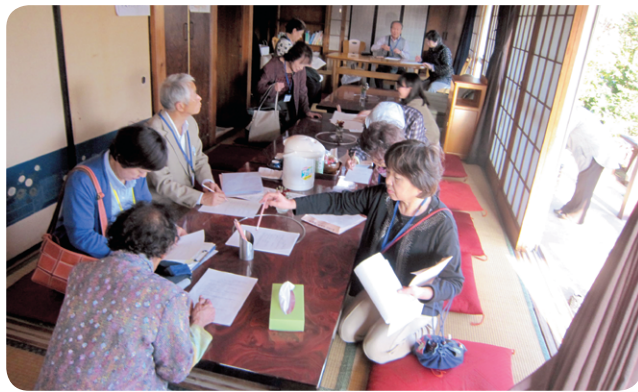
だんらの家での研修の様子

研修後には、「自分のところの“たまり場”に取り入れても良いかなと思うところもあった」「他市の状況を聞くことができ、とても勉強になった。今後のサロン運営を考えていく上で参考になった」との感想がありました。