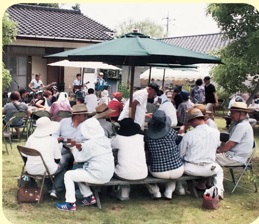
夏まつりでの演奏会