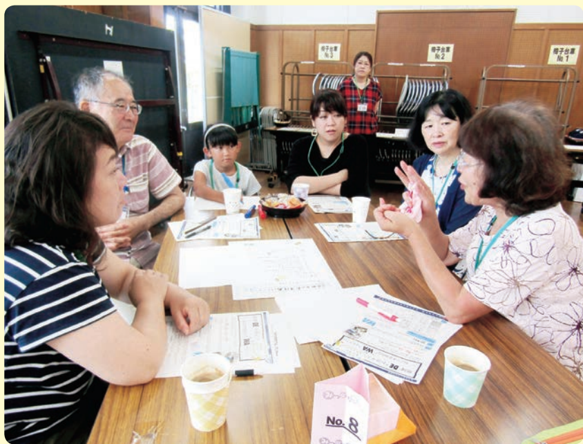
▲お母さんと一緒に参加しました。

その後、「お客さん」には、レシピを考える「シェフ」の立場になっていただき、同じメニューを選んだ人同士でグループを再編成しました。その中で、選んだメニューに込めた思いや、実現までの手順を話し合い、付箋紙を使って目に見えるかたちにまとめました。