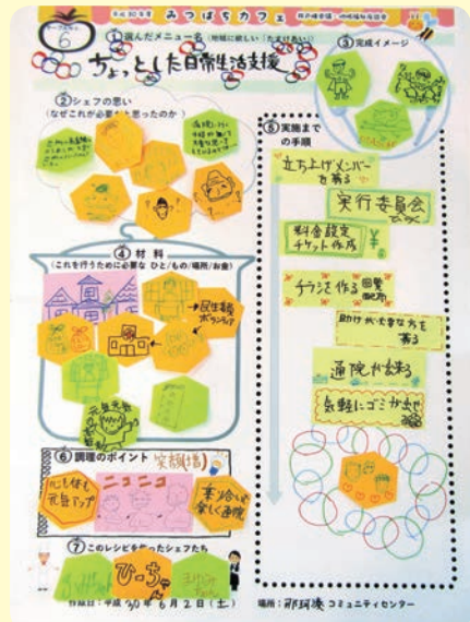
▲完成したレシピ。絵がたくさん!

『地域DEトライ!~私にできる身近なWAづくり~』 10月から12月にかけて講座を開催