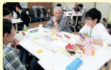
▲▼高校生や大学生も参加。