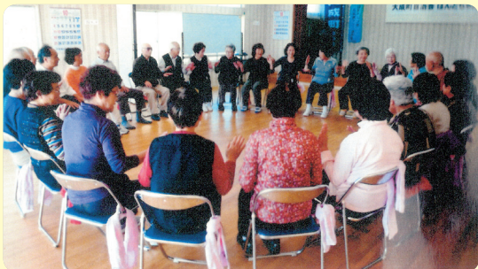
参加者みんなで輪になって体操