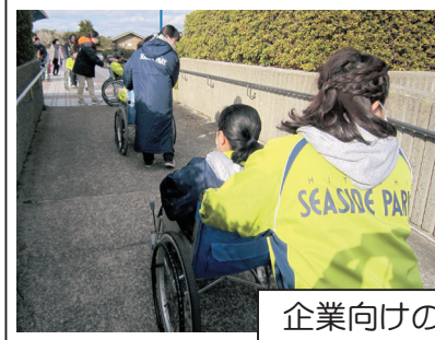
企業向けの福祉体験学習