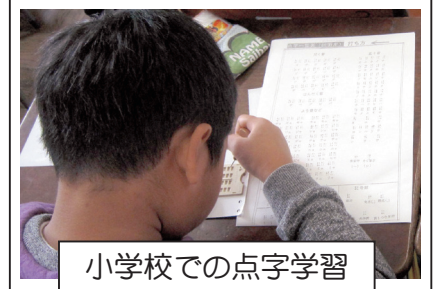
小学校での点字学習