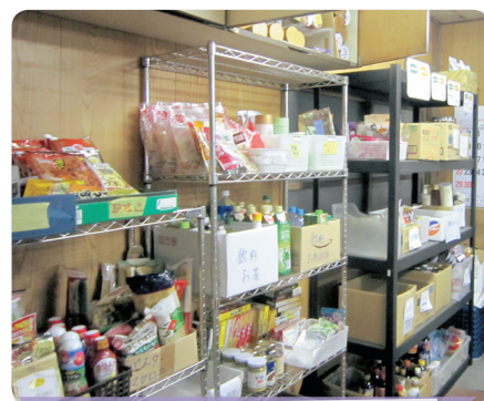
集められた食品 (茨城フードバンク水戸支部内)