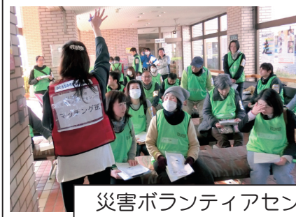
災害ボランティアセンター立ち上げ訓練の様子

日常的にボランティア活動の振興や支援・研修等を行い、災害が発生した際には災害ボランティアセンターを開設して被災地の支援、ニーズの把握・整理とともに、支援活動を希望する個人や団体を受け入れ、マッチング活動を行います。