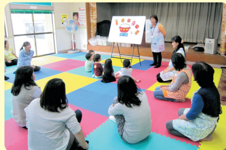
みんなでお話を聞いてるよ