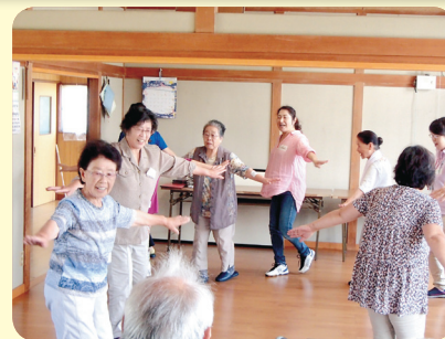
みんなで三浜盆踊り