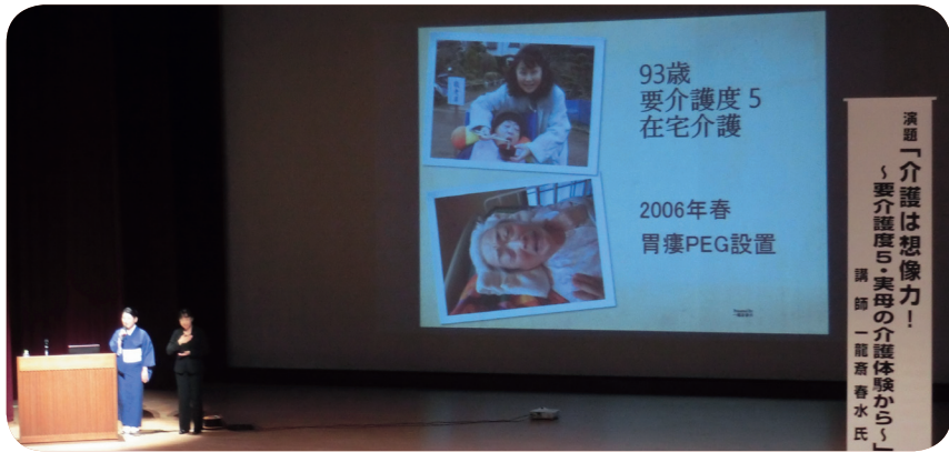
↓画像を交えての講演会