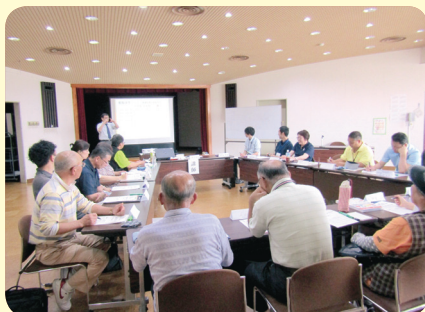
池田氏の講義にみんな真剣です