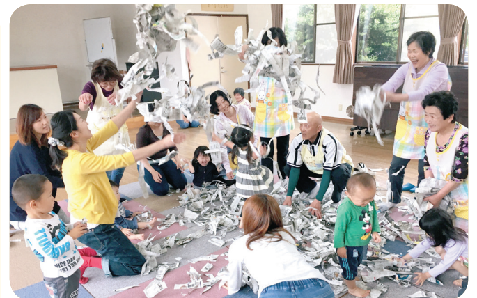
新聞紙で紙ふぶき～