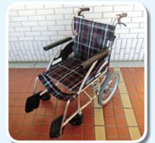
▲ご寄付いただいたプルタブで車いすを購入しました。ご協力ありがとうございました。