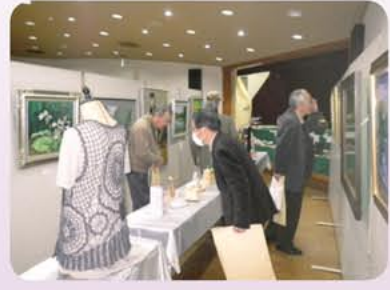
▲会場内をじっくり鑑賞中