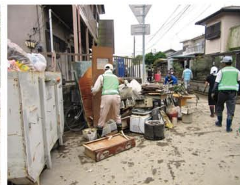
常総市災害ボランティア活動

「赤い羽根共同募金」は、次年度に社会福祉協議会等の行う事業等に助成されます。集まった募金の約70%は、募金をいただいた地域（市町村）で使われ、残りの約30%はより広域的（都道府県）に使われます。また、大規模な自然災害の被災地で活動するボランティアや、被災した社会福祉施設の復旧費用としての災害準備金としても積み立てています。