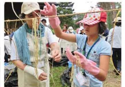
青少年ボランティアスクール 自然素材 草木染体験

要約筆記とは耳が聞こえない人や聞こえにくい人に話の内容を文字で書いて伝えることをいいます。