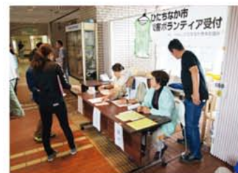
災害ボランティアセンター 立ち上げ訓練の様子

福祉をテーマとした映画鑑賞会を通して、子どもたちを含めた地域住民に「歳末たすけあい運動」の趣旨を広く理解する機会を設け、互いを思いやる助け合いの心を育むことを目的に実施しました。