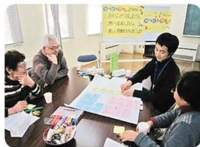
▶みんなの意見をカードに書いて並べながら話し合います。

テーマとしては、「～地域のつながりと支えあい“私の暮らす〇〇地区”～」と題して①自分の地区のいいところ②こうなってほしいところ③もっと素敵な地区にするために私たちができることを話し合いました。