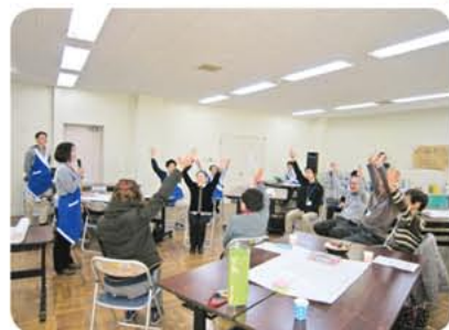
▶座談会の前にリラックス

今回は、行政（市役所・井戸端会議）と共催し、さらに誰もが意見を言いやすい雰囲気を作る為、リラックスした環境を提案し『みつばちカフェ』（※ワールドカフェ方式）と名付けて開催しました。