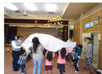
地域福祉活動の推進 子育てサロンの様子

市内の小地域において、ふれあい・いきいきサロン活動等を継続的に事業展開している団体へ経費の補助を行い、地域福祉の推進を図りました。また、市内で活動するボランティアサークルに対し、活動助成金を交付しました。