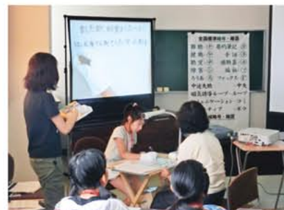
青少年ボランティアスクール 要約筆記

要約筆記とは耳が聞こえない人や聞こえにくい人に話の内容を文字で書いて伝えることをいいます。