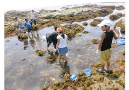
青少年ボランティアスクール 生き物観察 潮だまり