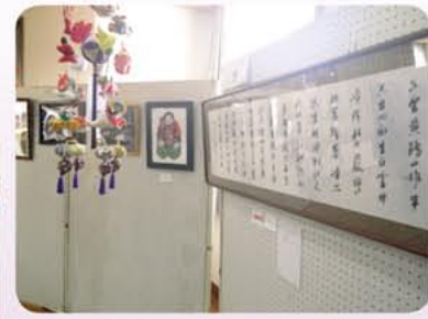
▲力作がそろう会場内