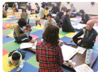
▶それぞれの意見をカードに並べたら、こんなに出来ました。