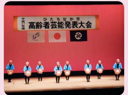
▲柳が丘クラブ赤とんぼの会による民謡舞「花笠音頭」