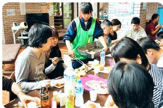
▲待ちに待った会食です！

そしていよいよバーベキューの開始！参加者・ボランティア・職員が4つのグループに分かれて、大きな鉄板で肉・野菜を焼きました。お腹が空いていたので、みんな美味しくお腹いっぱい食べました。