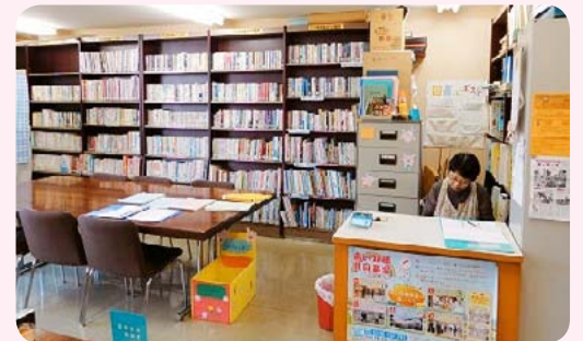
▲市立中央図書館からの配本一般図書、幼児、児童図書、紙芝居など約1,000冊あります。