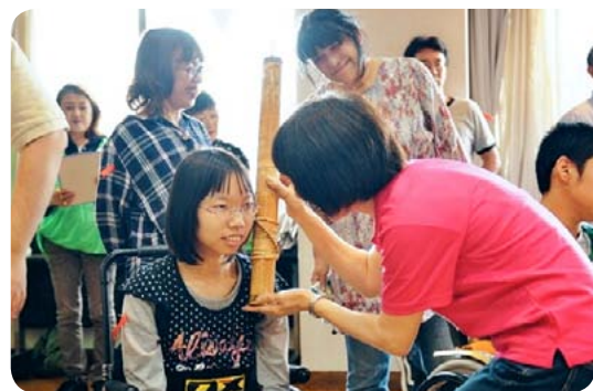
▲変わった楽器…どんな音？