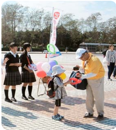
▲ひたち海浜公園 イベント募金

『赤い羽根共同募金運動』は『自分の町をよくするしくみ』として、みなさま一人ひとりに地域の福祉に関心を持っていただけますよう、広くPRしています。