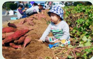
▲療育訓練センター 芋掘り

さわやかな秋晴れで、 絶好の芋掘り日和でした。 子供たちは汚れてもいい ように、準備万端！