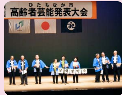
▲足崎愛好会による合唱「北国の春」

10月21日、市文化会館大ホールにて「市高齢者芸能発表大会」が開催されました。 出演者は市内高齢者クラブ会員37組519名、応援者426名、関係者等で約1,200名の方が集まり、盛大な発表大会になりました。演目は民謡、民謡舞、舞踊、リズム体操、合唱等多岐に渡っており、今年度新たに参加するクラブもありました。 日頃の練習の成果を発表する場とのことで、出演者は緊張の中での発表でしたが、いきいきと発表されており、終わった後の笑顔はととても輝いていました。