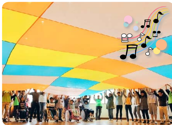
▲大きな布をみんなの力で広がれ～。

バーベキュー本番前のミュージックケアでは、歌や音楽に合わせてダンスを踊り、楽器・新聞・布を使ってみんなで楽しく体を動かしました。