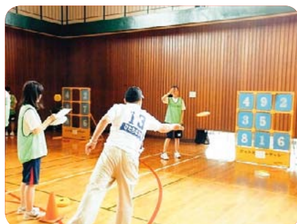
▲ストラックアウト