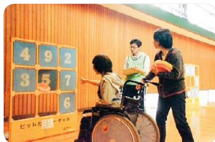
◀ストラックアウト

笑い声があちこちから絶えることがなく、一喜一憂しながら参加者同士コミュニケーションを持つ事もできました。