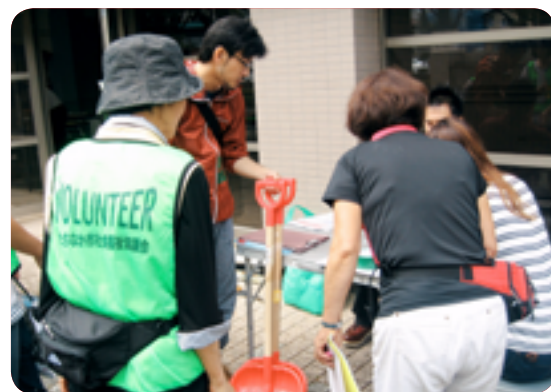
▲必要な資材を準備します

市社協では災害に備え、今回の訓練のほか市内の各団体と「災害ボランティアネットワーク」を組織し連携を強めたり、市民向けの災害ボランティア養成講座の開催や、災害ボランティアセンターの周知・啓発活動を行っています。