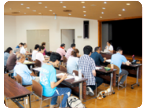
▲先生の話をしっかり聞きます

災害発生後、被災地の人々の暮らしを支える災害ボランティアの役割は極めて重要です。「災害ボランティア養成講座」は災害時の活動を円滑に行うために、どのような行動をとるか、どう対応すべきかを学び、実習や体験をとおして大規模災害に備えた支援体制づくりの講座です。