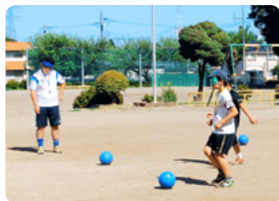
▲アイマスクをしてのブラインドサッカー

○プログラムに参加した児童からは「おじいさんたちと輪投げやユニカールを一緒にできて楽しかった」「目が不自由だといつもはできることができなくてとまどった」など普段と違う体験ができたことを喜ぶ声を聞くことができました。