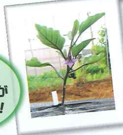
いろいろな 野菜の収穫が 楽しみです！