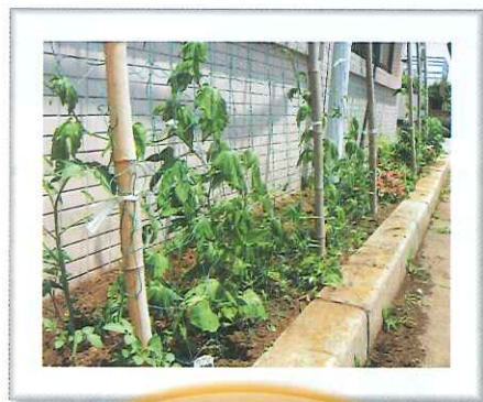
暑い日差しに備えて グリーンカーテンも 準備しました！