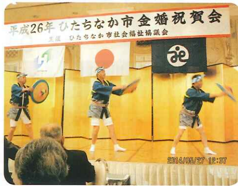
▲アトラクションが祝いの席に花を添えました。

あれから半世紀。世の移り変わりの中互いに支え合い、この日を迎えられました。出席者の皆様は、正装をしようしそうな表情で会場に入り、二人の記念撮影をしたあと祝賀会の席につき、多くの祝辞を受けたりお膳を囲んで昔を語らい、和やかなひとときを過ごしました。