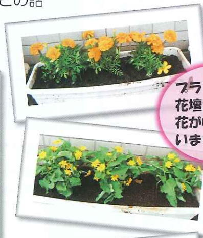
プランターや 花壇にきれいな 花が咲いて います！