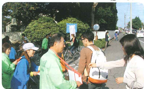
▲市内での募金活動

10月1日から始まった赤い羽根共同募金運動では、多くの市民のみなさまに、ご家庭で（戸別募金）、街頭で（街頭募金）、学校で（学校募金）、お勤め先で（法人募金）、あらゆる場面でご協力をいただき、ありがとうございました。