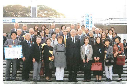
▲当日受彰されたみなさん

平成25年10月31日（木）、茨城県立県民文化センターにおいて第63回茨城県社会福祉大会が開催されました。この大会は、多年にわたり茨城県の社会福祉の発展に功績のあった方々が顕彰されています。ひたちなか市からは3団体・36個人が表彰を受けましたので紹介いたします。