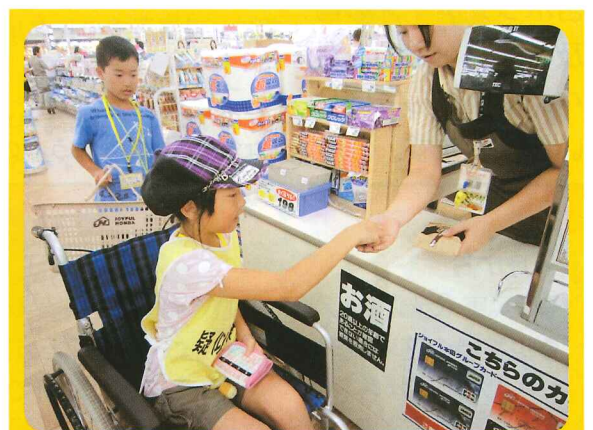
▲車イス体験(ジョイフル本田での買い物) 普段と違う目線での買い物。うまく渡せるかな!?