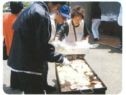
▲野菜やフランクフルトをジュージュー

参加した方々からは「楽しかった」「バーベキューがおいしかった」との感想が聞かれました。