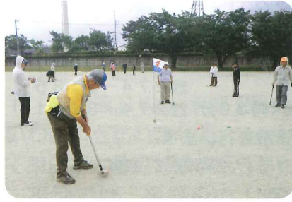
▲よく狙って！グラウンドゴルフより