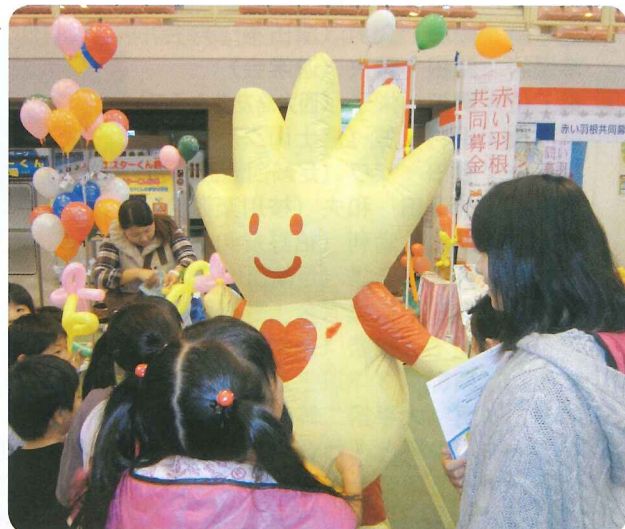
▲県社協マスコット“はんどちゃん”による募金活動