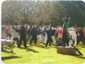
朝日の中で準備体操