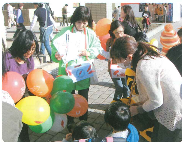
▲産業交流フェアでの募金活動

勝田駅をはじめ市内延べ46箇所で実施した街頭募金並びに、みなと産業祭や市産業交流フェアでのイベント募金では、延べ600名を超える多くの募金ボランティア