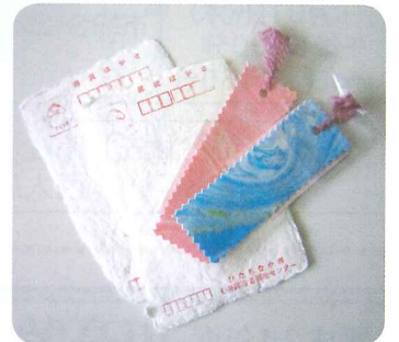
手すき和紙のはがき・しおり

【申込・問合せ先】市社協 心身障害者福祉センター ☎ 275-6721 西大島3-17-17