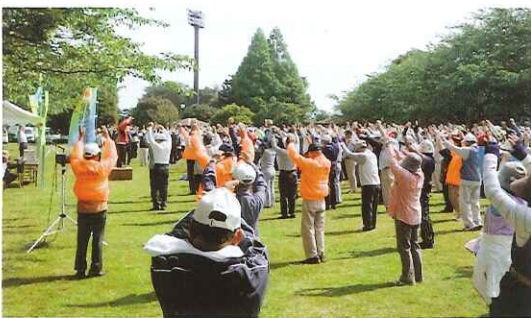
みんなで準備体操、イチ、ニイ、サン!