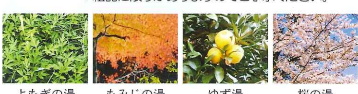
よもぎの湯 もみじの湯 ゆず湯 桜の湯 *写真はイメージとなります。

その他 スタンプラリーを行います。四季の風呂を利用するごとにスタンプを押します。四種類利用された方に粗品をプレゼントします。 *粗品に限りがありますのでご了承ください。