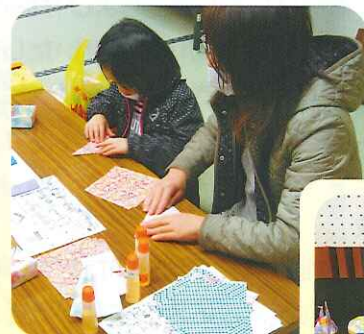
おりがみ上手におれました