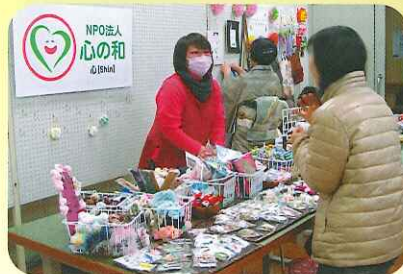
手作りの品物がいっぱいです