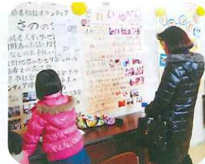
ボランティアサークルの活動紹介

寒い雨の中、約120名のボランティアの皆さんが長時間にわたりご協力をしてくださいました。ありがとうございました。