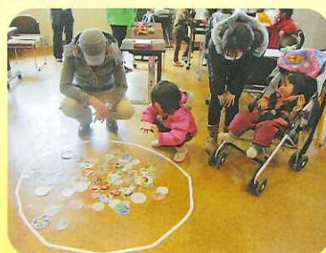
昔なつかしのメンコ遊び うまくひっくり返せるかな