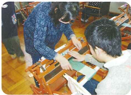
ボランティアの皆さんと 一緒にはたおり中!