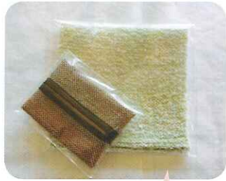
はたおりの製品 (コースターとティッシュ入れ)

市心身障害者福祉センターでは、社会適応訓練の一環として『はたおり講座』を実施しています。ご寄付いただいた毛糸を利用して生地を織り、製品を作っています。フリーマーケットや、ふれあいフェスティバルなどで販売していますので、どうぞお買い上げください。