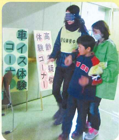
お母さんと一緒に高齢者の疑似体験 やさしく介助してあげてね