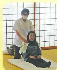
大人気のクイックマッサージ とっても気持ちいいです