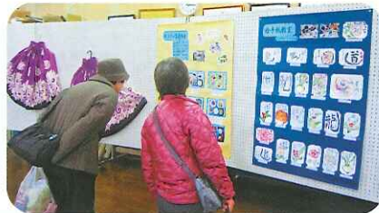
各種講座の作品展示