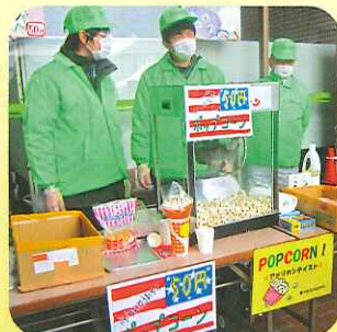
できたて熱々のポップコーンはいかが