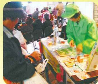
非常食の山菜おこわを試食中 意外に美味しいと好評でした

展示コーナーでは、ボランティアの活動を紹介する展示、車いすや高齢者の疑似体験、介護用品の展示、再生自転車の販売、非常食の試食など、数多くのコーナーが設置されました。講座紹介では、受講の様子や作品を展示し、絵手紙やおりがみのミニ体験講座では、多くのチャレンジする人でにぎわいました。