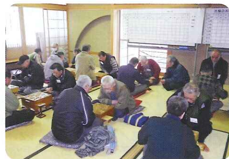
▲負けられない熱い対局