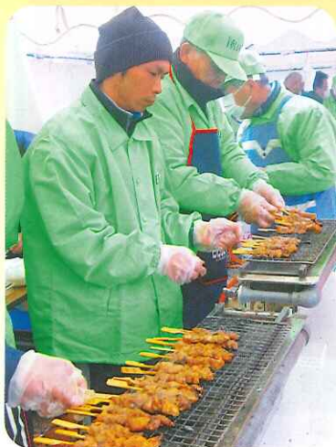
おいしい焼きとりだよ!!

開会式の後、昔ながらの木の臼と杵での餅つきで華やかにスタート。模擬店コーナーやフリーマーケットなども始まり、会場内がどっぴろくにぎやかに活気づきました。