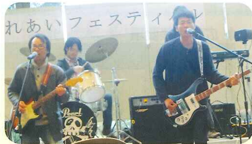
「TON・TIN・CAN」によるロック演奏 エコバックについて熱唱です!