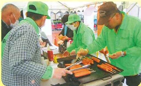
ジュージューと香ばしいにおいが最高です