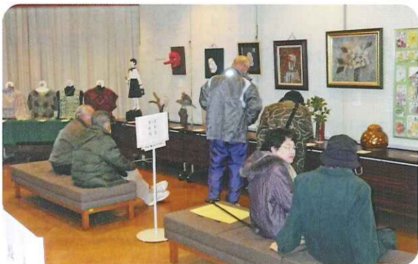
▲たくさんの作品が並ぶ文化創作展会場

初めての作品や3年がかりの作品など、さまざまです。期間中には、たくさんの方が見学に訪れ、作品に見入っていました。「まるで小さな美術館みたい!」という声が聞こえてくるような作品展でした。