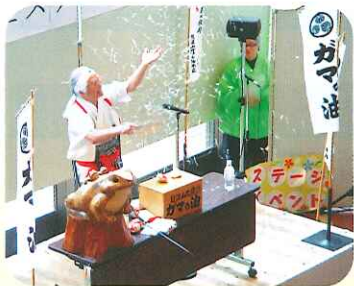
ガマの油売りリロ上 紙ふぶきが舞います

ステージイベントでは、手話の歌や朗読、ハワイアン演奏とフラダンス、ガマの油売りリロ上やマジック、市職員結成バンドによるロック演奏など幅広いジャンルの演目が大集結。外の寒さも吹き飛ばし、拍手喝采!心あたたまるステージで大変盛り上がりしました。