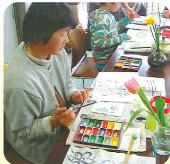
絵手紙のミニ体験講座 どこから色を塗ろうか考え中

寒い雨の中、約120名のボランティアの皆さんが長時間にわたりご協力をしてくださいました。ありがとうございました。