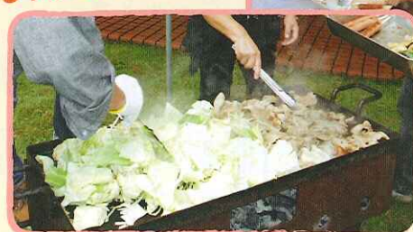
演奏を聞きながら…