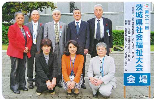
▲当日、出席された皆さん