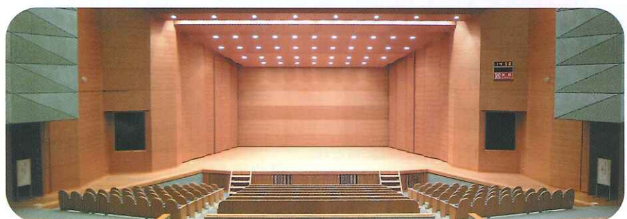
▲『音の響きが素晴らしい!』と評価されている音響反射板を組んだ舞台