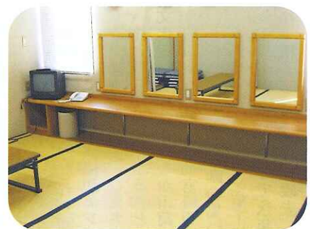
▲ゆっくりとくつろげる楽屋。洋室と和室があります。(シャワー室完備)