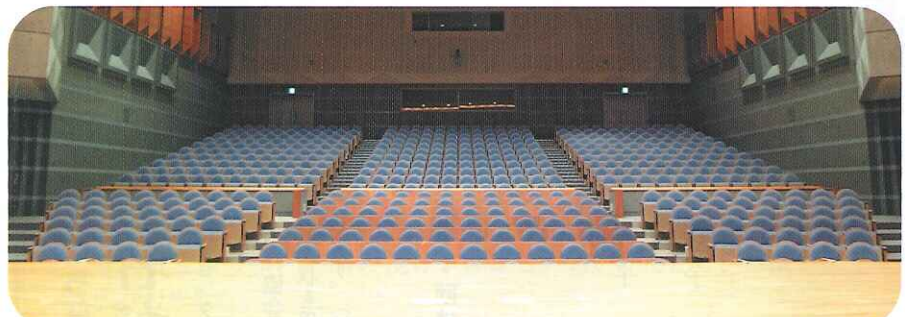
▲客席は540席(固定席520、車イス席10、母子室10)