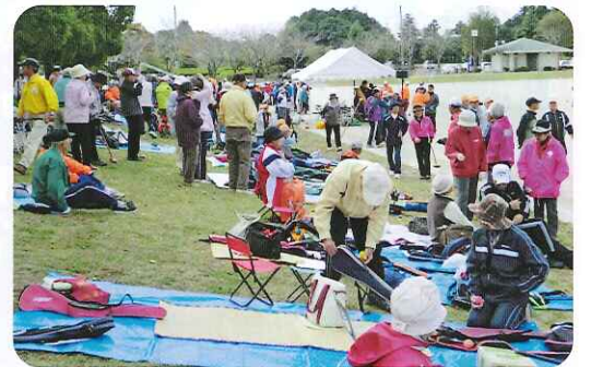
競技にむけて…準備中