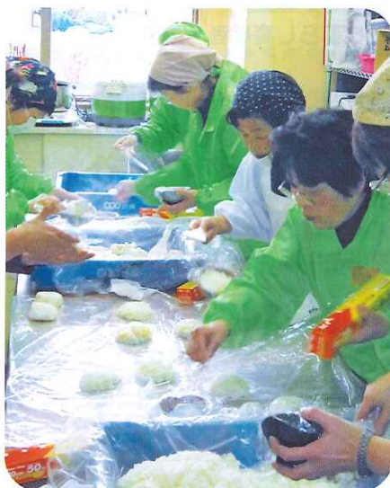
▲避難所でのおにぎりづくり

また『片付けレスキュー隊』には、被災された方宅の室内・室外の片付け作業も支援していただきました。