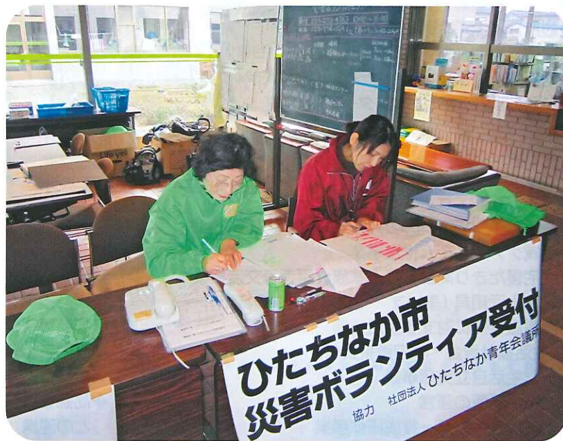
▲総合福祉センター内に災害ボランティアセンターを設置

市社協では、東日本大震災後の3月16日に、ボランティアによる救援活動を行うため、『災害ボランティアセンター』を立ち上げました。