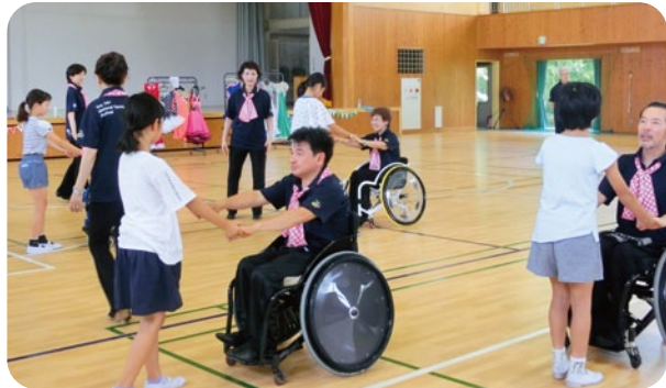
車いすダンス体験