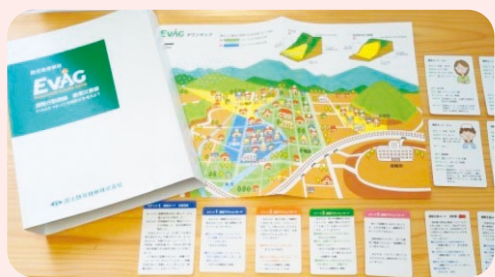
◀ 避難行動訓練 EVAG(イーバッグ)