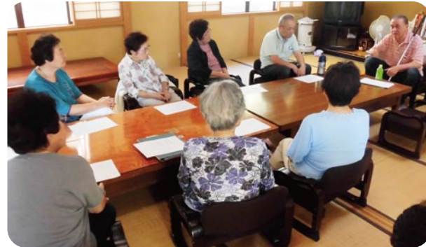
サロンなどでの伝承活動

施設などの行事で、ボランティアが活動できるように受け入れ体制を整え、より良い活動ができるように調整しています。