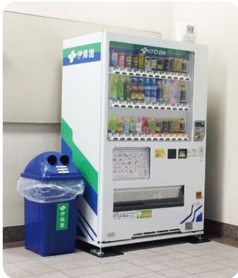
▲市ヘルス・ケア・センター様 (災害時飲料無償提供型)