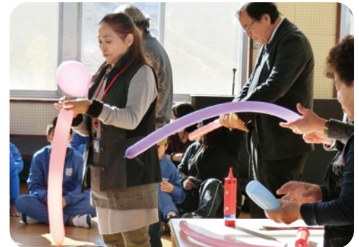
特別支援学校でバルーンアート体験