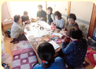
手芸におしゃべり、和やかです