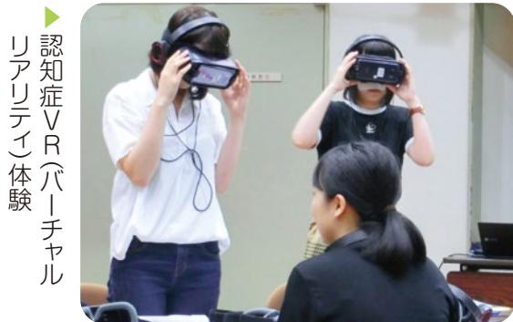
認知症VR(バーチャルリアリティ)体験