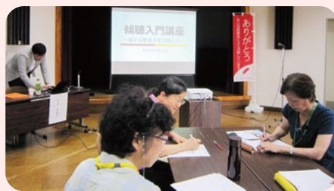
◀ 昨年度の講座様子