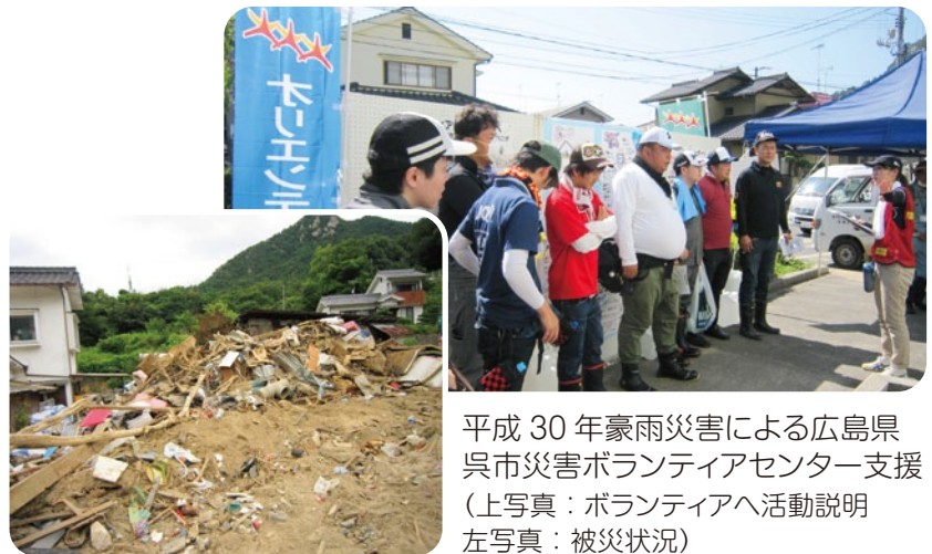
平成 30 年豪雨災害による広島県呉市災害ボランティアセンター支援 (上写真：ボランティアへ活動説明 左写真：被災状況)

そのほか、市民向け防災講座、災害ボランティアセンター設置訓練(他市町村の支援)などを実施しています。