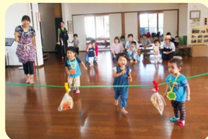
運動会でパン食い競争！