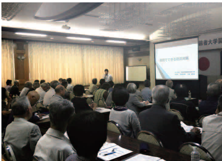
第1回講義「家庭でできる防災対策」の様子