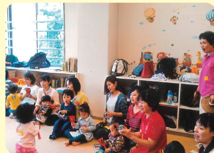
親子の触れ合いを大切にしています

市毛コミュニティセンター児童室において、毎月第2水曜日、第4月曜日の午前10時から11時30分まで開催しています。活動内容は、ミュージックケア、親子ふれあい遊び、手遊び歌、体操、絵本の読み聞かせ等です。