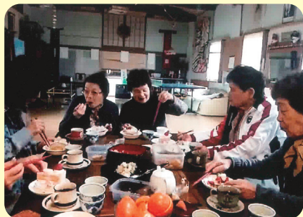
元気の源は食事から

東日本大震災の時に、所有の建物が無事だったことをきっかけに地域の方とのつながりを作るため、2013年11月に佐野地区で発足しました。ベニア板の卓球台から始まりましたが、様々な協力を得て、現在は卓球の他、吹き矢、麻雀などをしています。家に引き込まず、楽しく健康に過ごせる場所を提供できるように活動しています。誰でも自由に利用できますので、ぜひいらしてください。