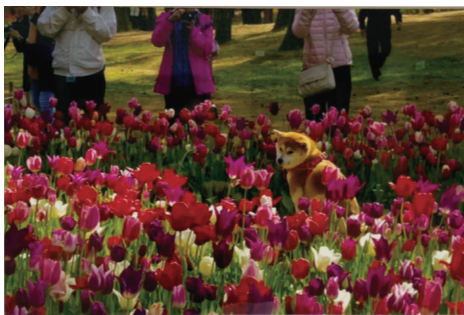
▲ 優秀賞 高田 宗武【「あ～疲れた」】