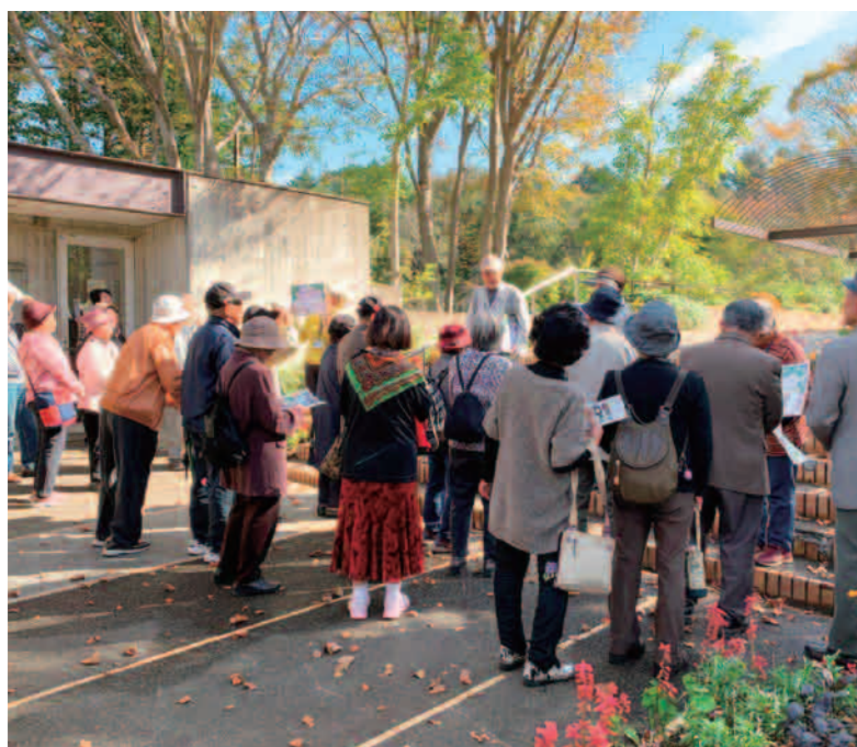
第5回移動学習 「茨城県庁・県議会議事堂・水戸市植物公園見学ツアー」の様子