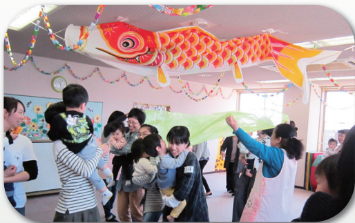
みんなが集まるふれあい・いきいきサロン

市内の子育て世帯や高齢者の憩いの場となるふれあい・いきいきサロンの活動費を51団体に助成しました。