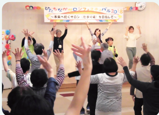
【昨年の子育て支援サロン「しよん」による活動体験の様子】 サロン体験と一緒に盛り上がりま