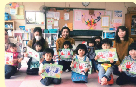
みんなで思い出に手形を押しました

“安心、簡単、おいしい”と人気のおやつ作りも親子で一緒に楽しめ、年2回実施しています。みんなで食べるとおいしさも倍増です。“地域の子どもはみんな我が子!”そんな優しさがいっぱいあるサロンです。