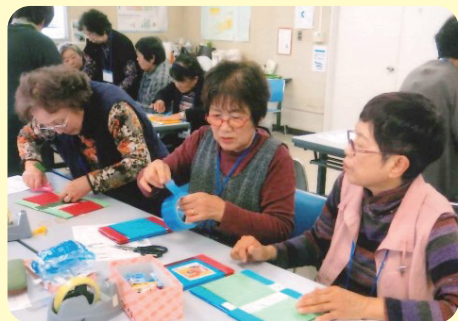
笑いあり、真面目あり。手芸品を作りました

開催時間は、午後1時30分からおおむね2時間を目安に実施していますが、おしゃべりに夢中で時間を忘れる事も度々あります。参加希望の方は遠慮なさらず、いつでもお気軽にお越しください。