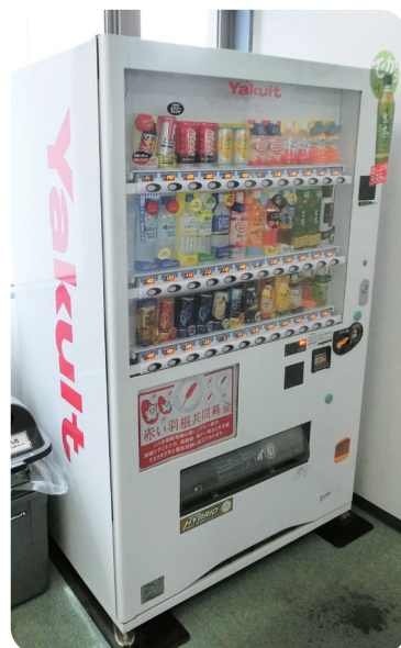
▲ 茨城県信用組合 勝田中央支店 様

問合せ先 ひたちなか市共同募金委員会(社協 地域福祉係内) TEL:274-5135