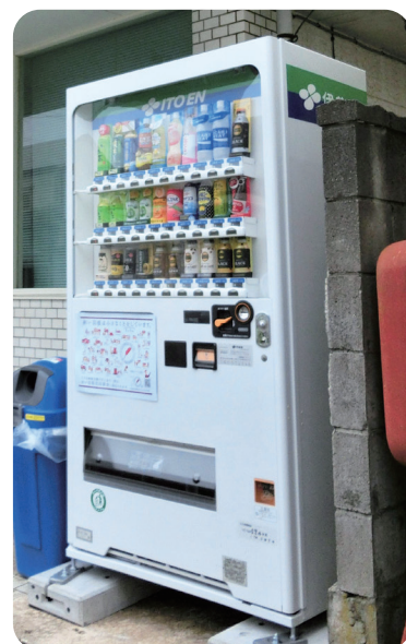
▲ 湊中央地区内 個人宅 様