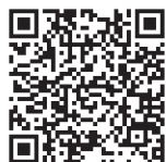
申込専用フォーム

※こちらの研修会は市報5/10号に掲載された「ファミリー・サポート・センター研修会」の日程が延期されたものです。