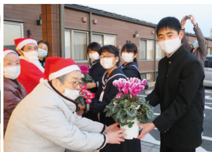
平磯中学校 施設訪問