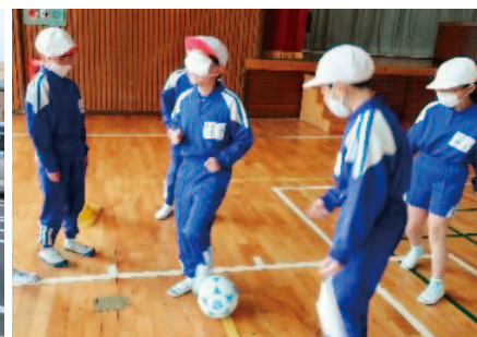
堀口小学校 ブラインドサッカー体験