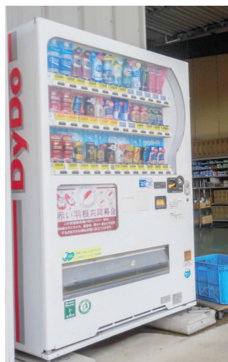
(株)サワハタキャリアサービス様

ひたちなか市共同募金委員会 (ひたちなか市社会福祉協議会内) TEL:274-5135