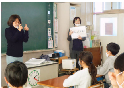
田彦小学校 手話体験

社協では、小・中学生を対象にボランティア活動の実践と社会福祉への理解と関心を高めるために、市内小中学校全校を福祉教育校として指定しています。