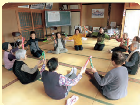
歌に合わせて、バトン体操に挑戦