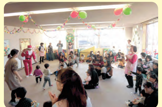
クリスマス会にサンタさん登場

【訂正】1/25号「福祉ひたちなか（No.140）」2面ふれあい・いきいきサロン紹介 シリーズ第9回となっておりますが、正しくは第10回でした。お詫びして訂正いたします。