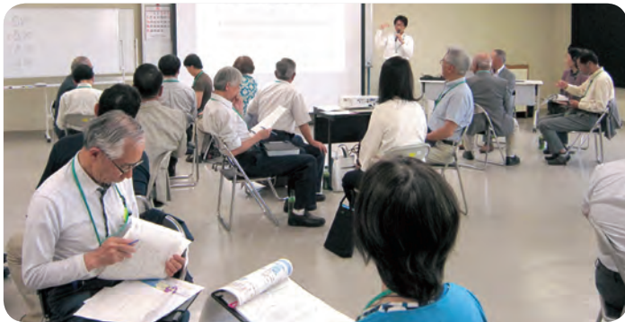
住みやすい地域づくりを検討しています

「二中地区ふれあい会議」では、今後も引き続き高齢者の方が住み慣れた地域で、元気に安心して暮らすことができる地域活動を検討してまいります。