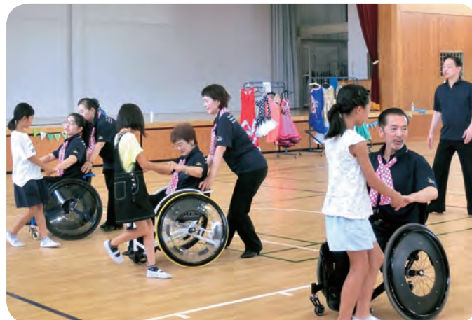
【青少年ボランティアスクール】 車椅子ダンスの様子