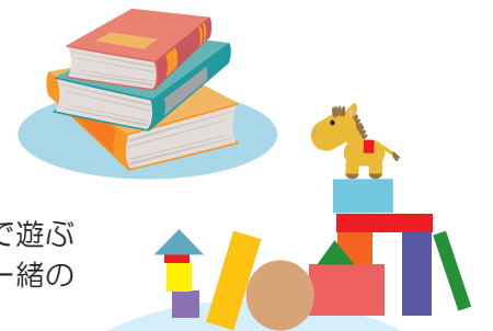
図 書 1人5冊まで2週間