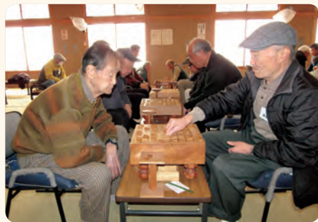
静かな会場から伝わる緊張感 真剣なまなざしで盤面に向かい、勝利を目指しました。