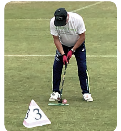
【高齢者健康推進事業】 グランドゴルフで使用する用具を購入