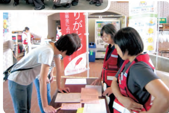
【災害ボランティア事業】 災害ボランティアセンター 立上げ訓練の様子

＜歳末たすけあい募金の助成を受けて、ひたちなか市社会福祉協議会が平成30年度に行った事業＞