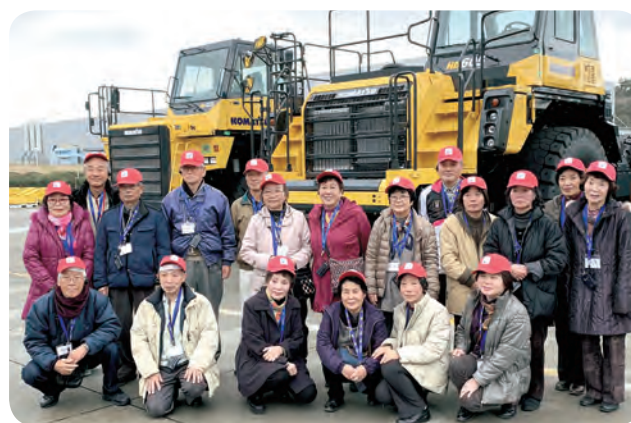
【外出支援事業】 (株)コマツ茨城工場に行きました。

系ぐるま 日立化成労働組合山崎支部 ひたちなか市民クリスマス実行委員会 ヤマザキ製パン従業員組合千葉支部