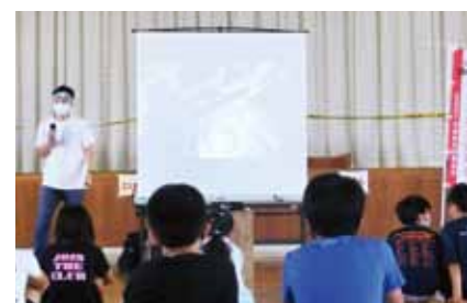
ボランティアスクール防災運動会の様子