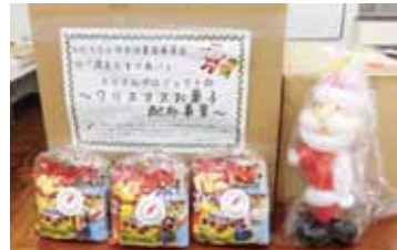
クリスマス用お菓子

歳末期のイベントにおいて、子どもたちが笑顔で楽しめるように、放課後等デイサービスや子育て・子どもサロン、子ども食堂実施団体にクリスマス用お菓子を配布しました。