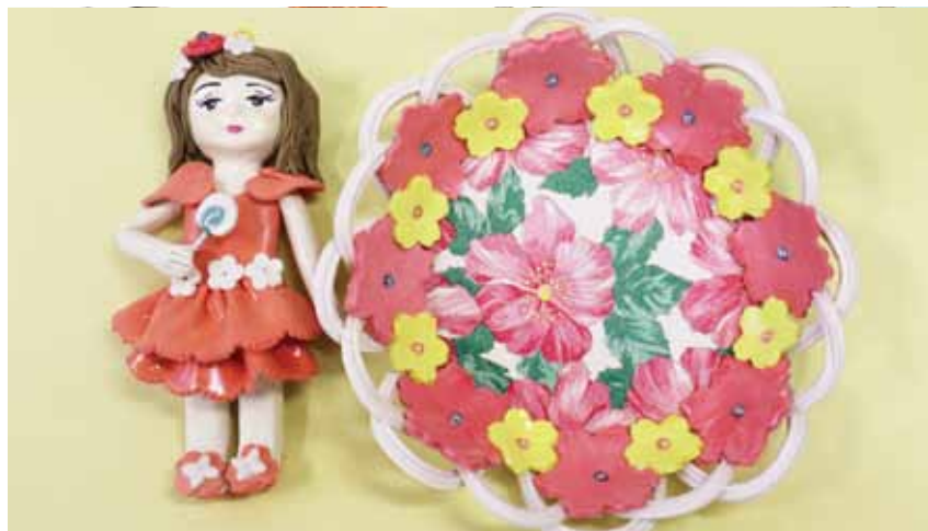
受講生作品 人形と小物入れ(創作粘土ロマンボール)