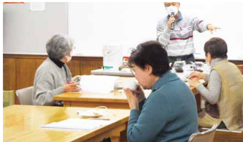
おいしい紅茶を飲みながら産地や種類を学びました(紅茶でリラックス)