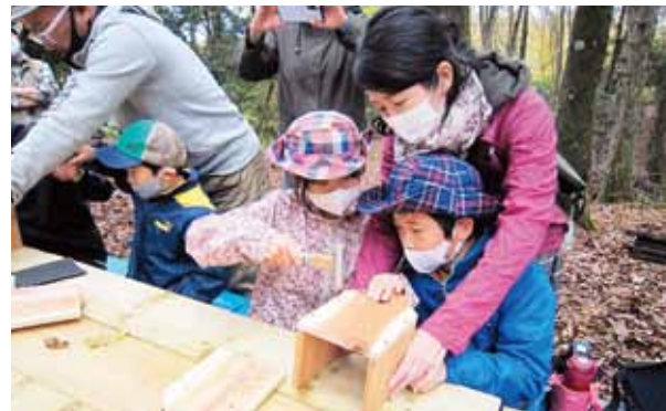
巣箱を作りました(くらし協同館なかよし)

団体名：はくあき 事業内容：子ども食堂での クリスマス会 助成内容：材料費、衛生用品購入費