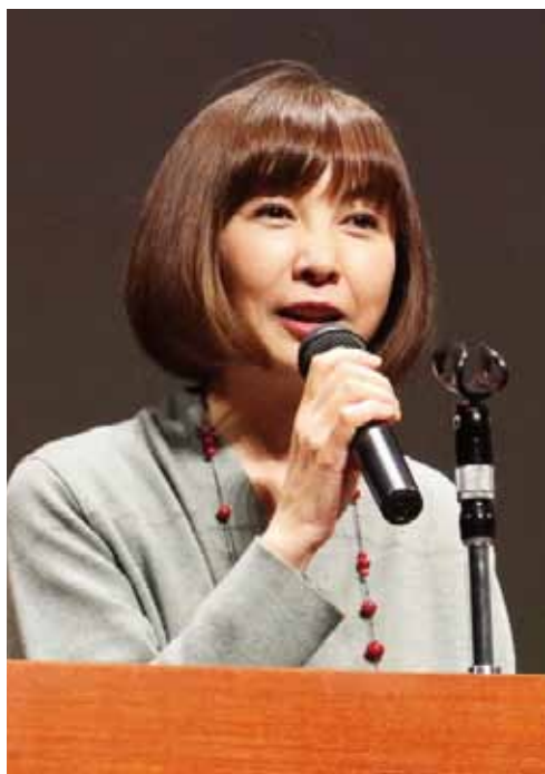
貴重な体験談などをお話いただきました