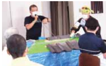
災害時お助け隊養成講座の様子