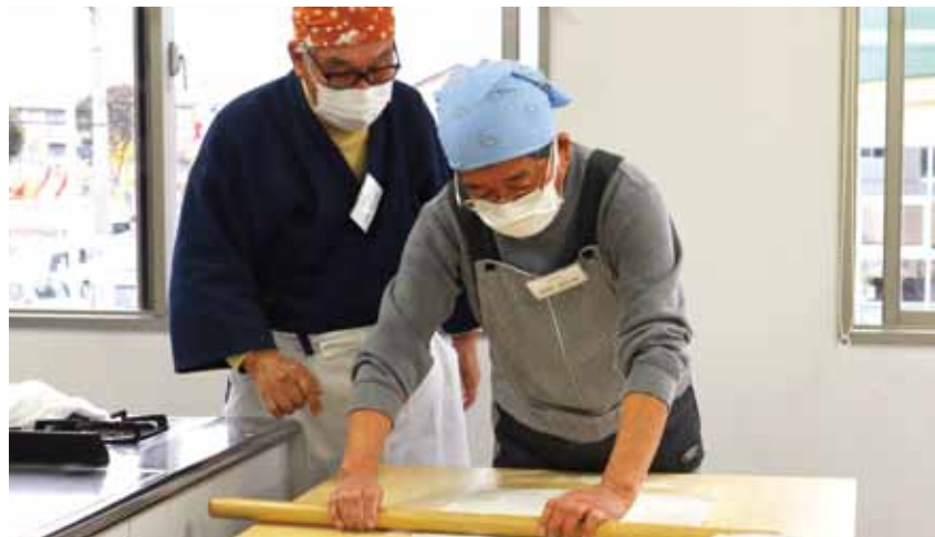
めん棒でそばを均一に伸ばします(そば打ち)