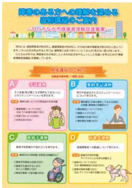
講座の案内チラシ

市内には、視覚障害者、聴覚障害者、その他身体障害者が約3,600名生活しています。これらの方には、健常者には気づきにくいたくさんの「見えない壁」があります。障害のある方が外出する時や生活している中での困りごとに対して、ちょっとした声掛けなどで解消されるものもあります。そのような相手の立場に立って考え、ちょっとした気遣いを学ぶ「ちょこっと体験講座」を行っております。ぜひ自治会や事業所等の障害者理解への啓発講座としてご検討ください。