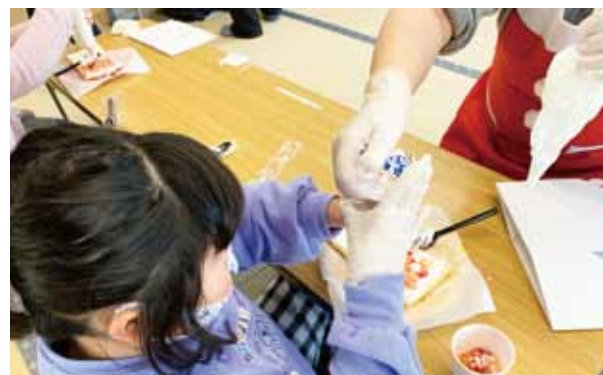
クリスマスケーキを作りました(はくあき)