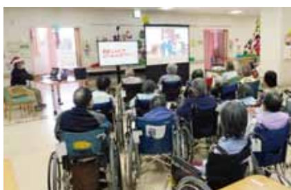
オンライン開催でのボランティアの様子