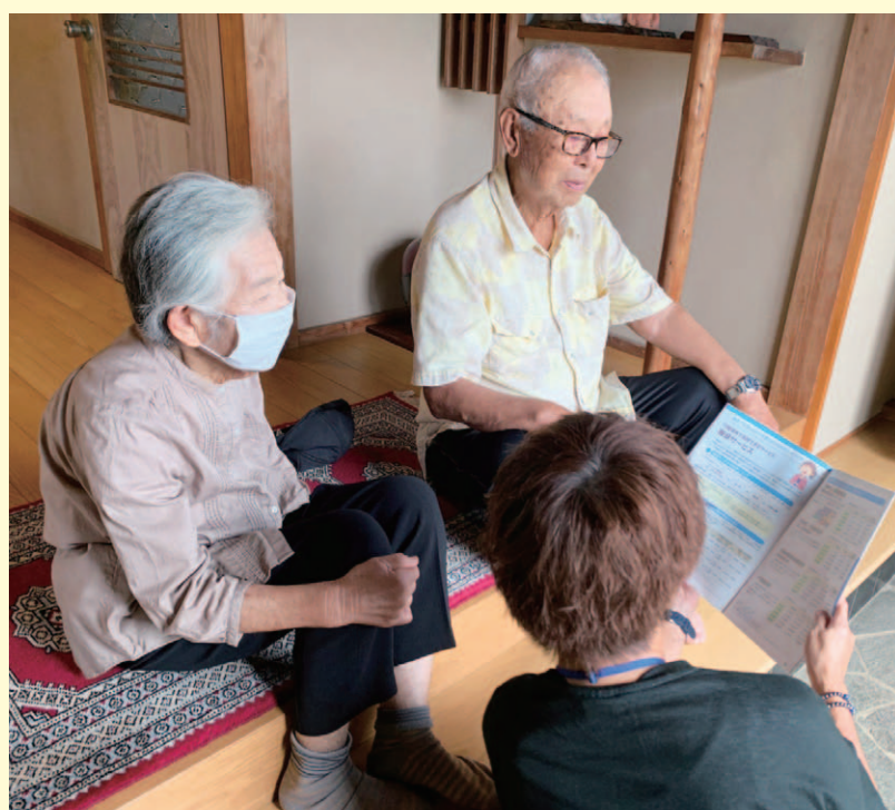
▲実際にご自宅へ訪問の様子

月~金(土・日・祝日・お盆・年末年始を除く)に訪問いたします。 訪問時間は15分前後で、無料をご利用いただけます。