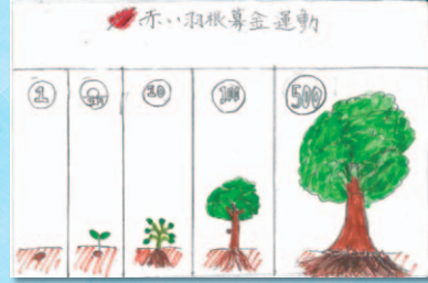
おびとさん (小学校6年)