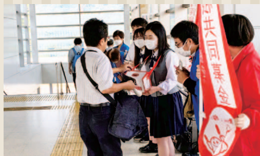
▲勝田駅での募金の様子