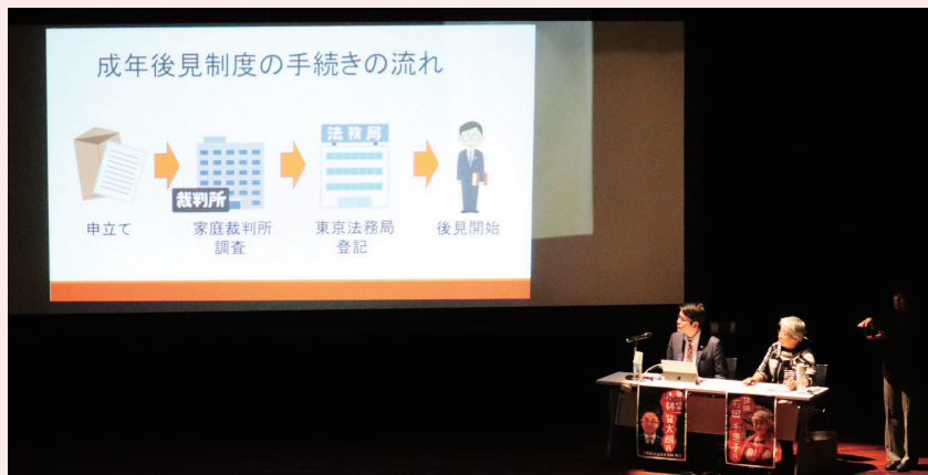
▲第2部 制度説明の様子

参加者からは「成年後見制度について学ぶよい機会になった」、「お母ちゃんのするどい質問のおかげで、制度がより理解ができた」などのお声をいただきました。