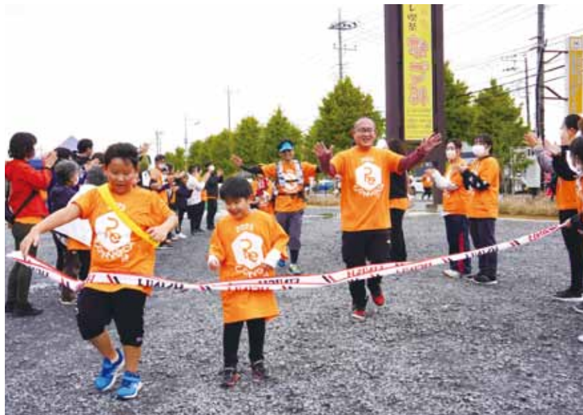
▲社協も参加し、アンカーを務めました

RUN 伴は、認知症の人とその家族、支援者や一般の人がリレーしながら一つのタスキを繋いでゴールを目指す全国的な認知症の啓発イベントです。