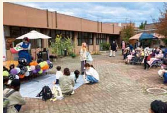
▲絵本の読み聞かせ、手遊びの様子

あいあい助成金を利用させていただき、みんなの〇をシェアするマルシェを開催させていただきました。入所者の方も地域住民の方も、出店やステージなど楽しんでいました。ありがとうございました。